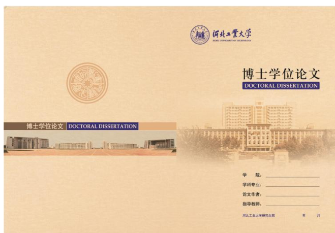
图 2.1 博士学位论文封面样式