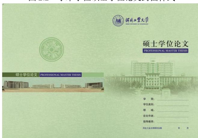
图 2.3 专业学位硕士学位论文封面样式