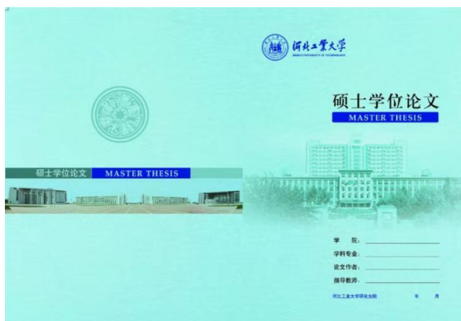
图 2.2 学术学位硕士学位论文封面样式