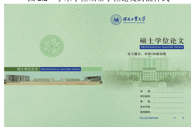
图 2.3 专业学位硕士学位论文封面样式